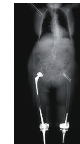
La radiografia mostra l'impianto SOIB

Nel primo caso è necessaria l'introduzione di due viti mentre negli altri casi di una sola. In linea generale la metodica può essere proposta a tutti i pazienti che hanno subito fratture o che presentano patologie ossee per cui è necessario un supporto meccanico e/o un apporto biologico di sostanze osteoconduttive, osteoinduttive, cementi o farmaci per curare l'osso.